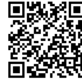
宗派公式 Web サイト↑